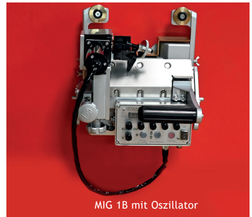
MIG 1 B mit Oszillator