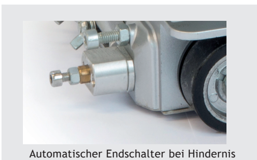
Automatischer Endschalter bei Hindernis

Ladegerät, Batterie oder Netzteil, Kabelset 15 m,