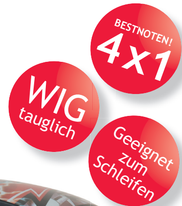
Bestview VIII, Grafik Artikelnr.: 02.10.01.00054 (alt:31877223)