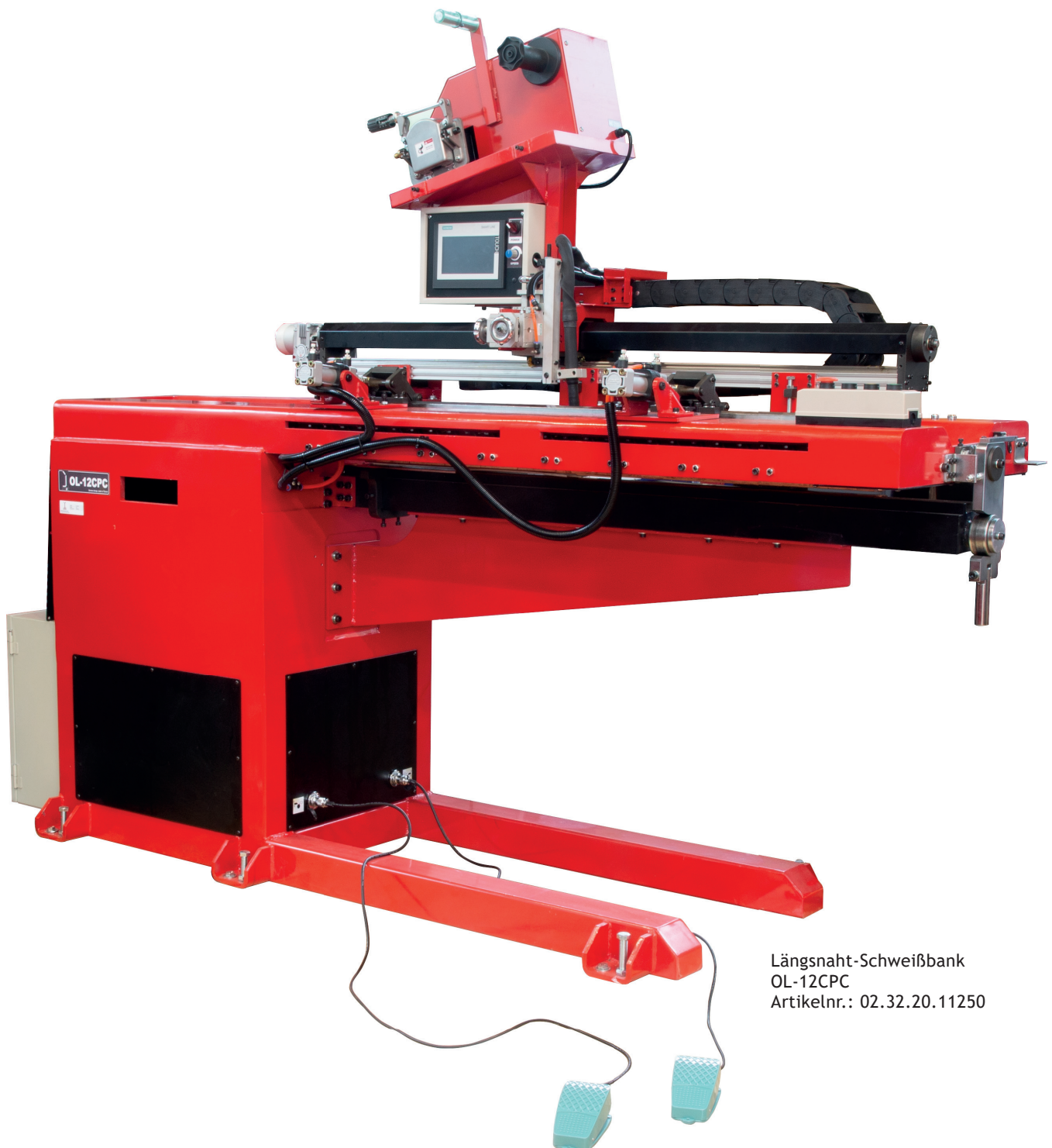
Längsnaht-Schweißbank OL-12CPC Artikelnr.: 02.32.20.11250

Für welches Modell Sie sich entscheiden, hängt von Ihrer Schweißnahtlänge ab. Denn die OL Modelle sind für Werkstücklängen von 460mm bis 3060mm, oder für Werkstückdurchmesser von 65mm bis 1000mm erhältlich.