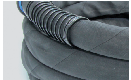
Stabiler, flexibler Schutzschlauch (nur bei UF MIG 400).