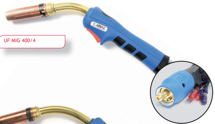
UF MIG 400/4