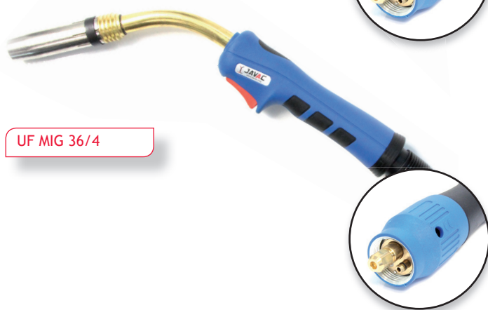
UF MIG 36/4