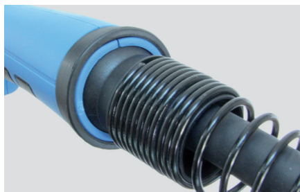
Kugelgelenk und Knickschutz am Griff für flexibles Arbeiten.