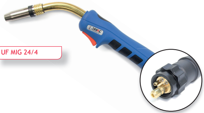
UF MIG 24/4