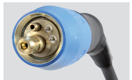
Federnd gelagerte Kontaktpins.