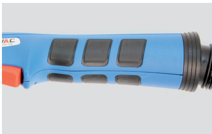
Hochwertige, ergonomisch geformte Griffschale.