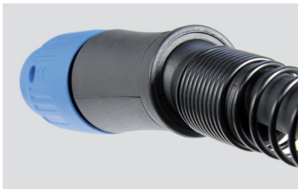
Kugelgelenk und Knickschutz am Eurozentralanschluss.