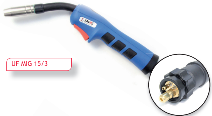
UF MIG 15/3