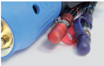
Schutzkappen auf Wasserschläuchen.