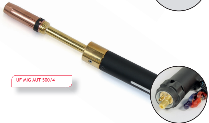
UF MIG AUT 500/4