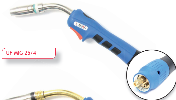
UF MIG 25/4