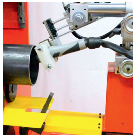
Auch zum Schweißen im Rohrinernen geeignet